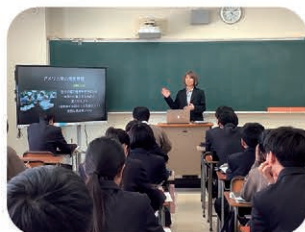
知的好奇心を高める 特進クラス講演会