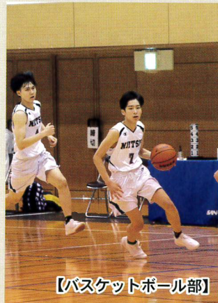
【バスケットボール部】